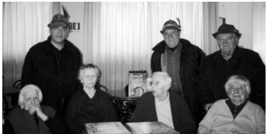
Consegna dei doni a Natale

Sono state ricordate la cerimonia a Muris per i Caduti del Btg. Gemona nell'affondamento della nave Galilea, quella al Tempio di Cargnacco per i Caduti di Nicolaieswka in Russia e quella sul monte Bernadia. Per quanto riguarda l'attività di Protezione Civile, nel 2003 i soci non sono stati impegnati ma entro breve bisognerà dare la disponibilità di volontariato o meno, secondo quanto previsto dal nuovo accordo tra Ana e Regione.