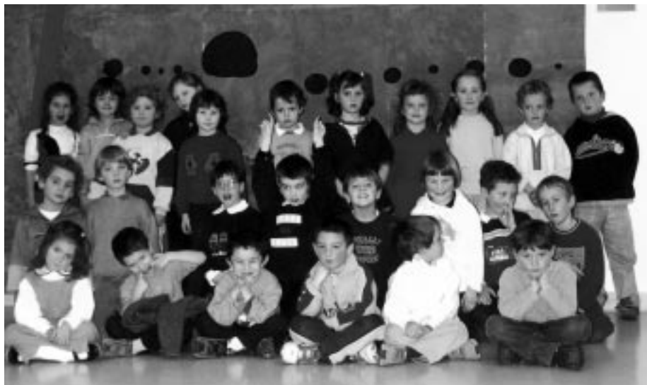
I TIGROTTI DELLA SCUOLA D'INFANZIA DI VILLA PRIMAVERA I TIGROTS DE SCUELE DE INFANZIE DI VILE PRIMEVERE

E je diventade la nestre cjare amie e ogni volte nus laude, parcè che o sin fruts une vore atents e ordenâts. Nus dis simpri che o sin plui brâfs dai fruts plui grancj e cualchi volte si comôf,