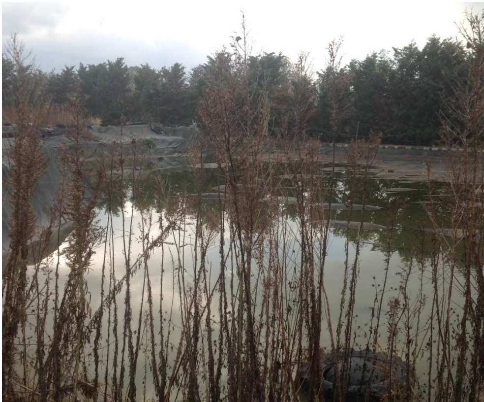
Area con ristagno superficiale di percolato