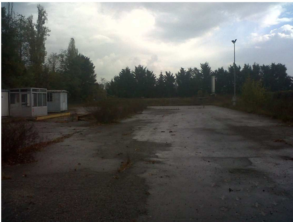
Area di ingresso della discarica