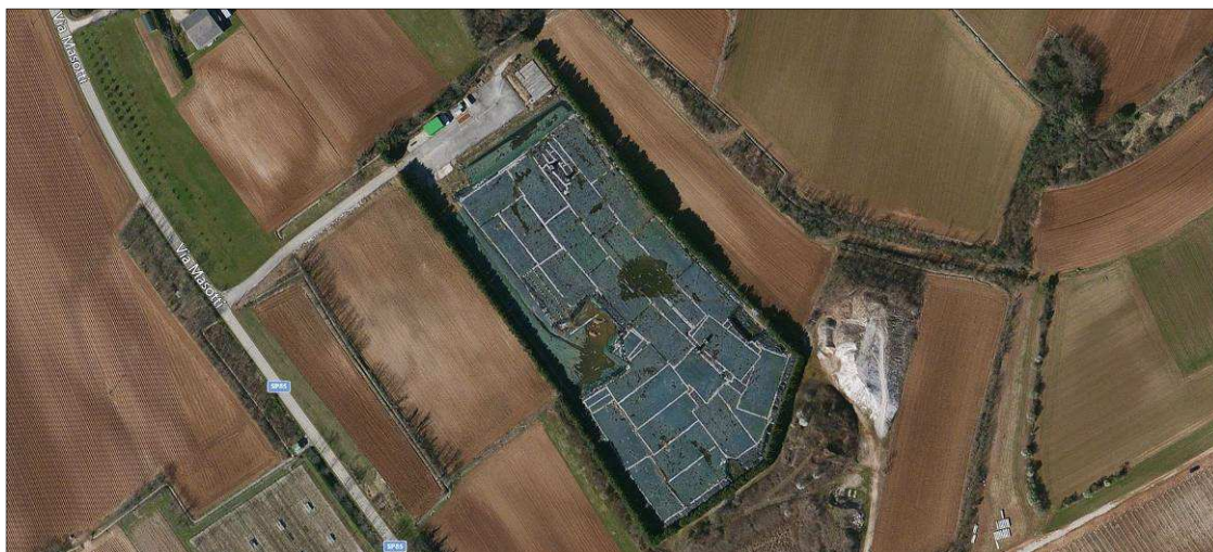
Figura 3. Stato attuale della discarica

Si precisa, inoltre, che attualmente non è nota l'eventuale presenza di percolato nella cosiddetta rete spia .