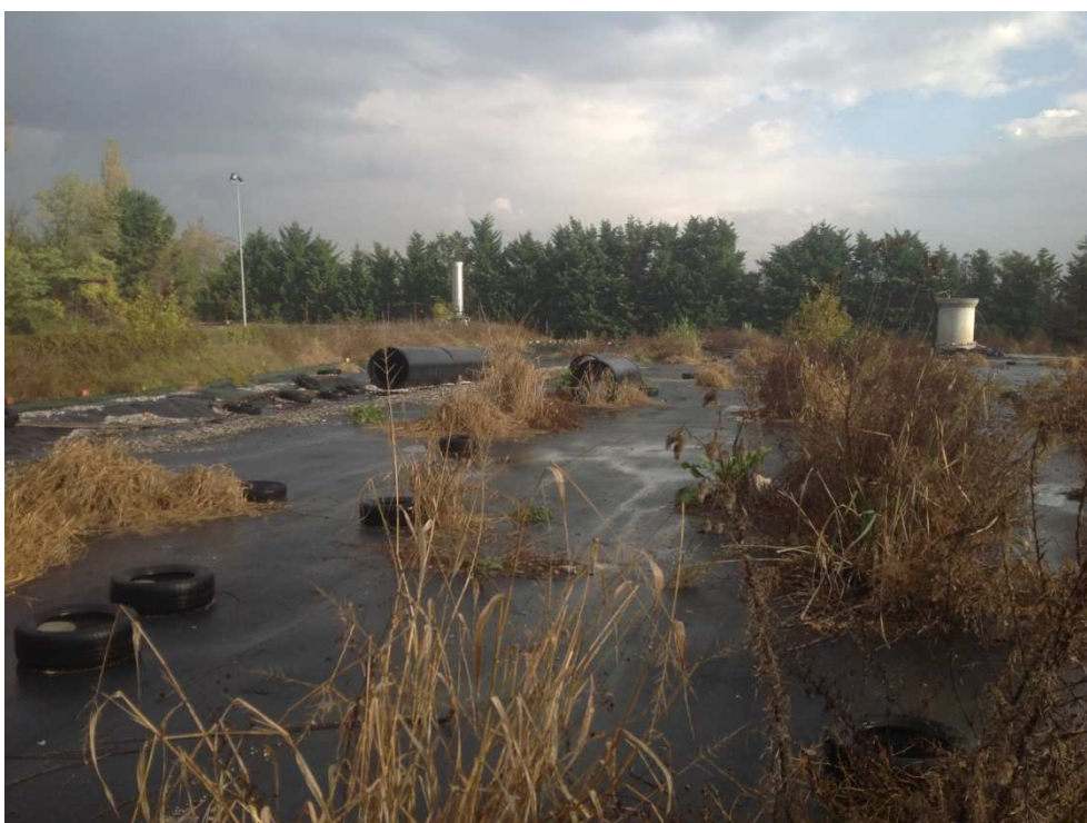
Area interessata da vegetazione infestante (tutta la copertura superficiale)