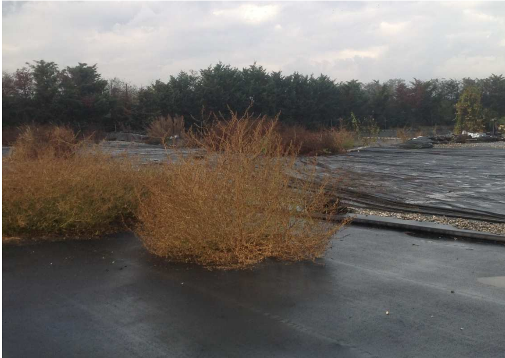
Area interessata da vegetazione infestante (tutta la copertura superficiale)