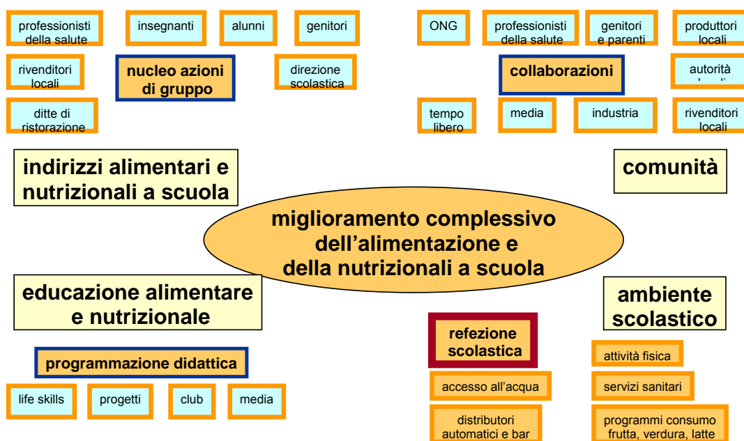
Figura 1: approccio olistico delle politiche alimentari e nutrizionali per la scuola

Il presente lavoro si inserisce nell'elemento "ambiente scolastico" e si articola anche su altre dimensioni che il pasto a scuola intercetta, con speciale attenzione ai determinati sociali, per portare in primo piano la centralità dell'età scolare che necessita di precoci e adeguati interventi nutrizionali, al fine di soddisfare i particolari fabbisogni fisiologici di nutrienti e di energia.