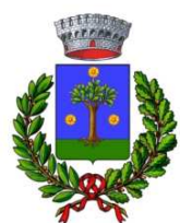
Comune di Passignano del Friuli