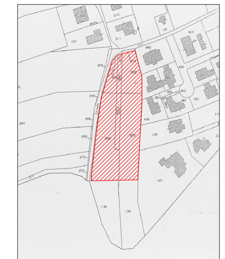
ESTRATTO DI MAPPA Comune di Campoformido N.C.E.U. Fig. 12 mapp. 548-549-550-551-552-553 rapp. 1:2000